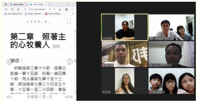
青職線上追求李常受文集

說到『神成為人，為要使人成為神』，還有每篇必出現的詩歌附 5 首『何大神蹟！何深奧祕！』。這些熟悉到會背記的內容，卻成為聖徒的拯救與題醒，一再題醒這是神的經綸，當是我們生活、工作、服事的中心。在信息中，也有大量主恢復的歷史，過去聖徒不太在意的歷史內容，這次讀到卻深受感動。這些信息給我們看見弟兄們愛主、愛主的話並忠於這分職事，使他們無論外面的環境如何為難，仍然為主的需要擺上自己。