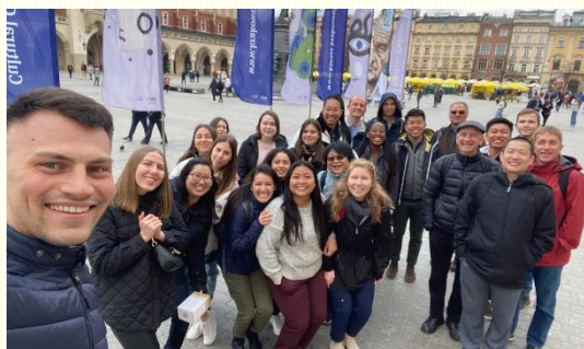
在波蘭克拉科夫老城傳福音