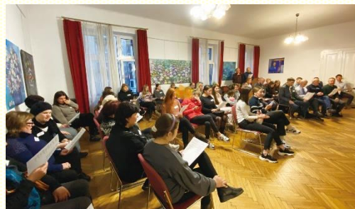
第三次歡迎會來了將近四十位

福，蒙恩彼此相加，有歡笑有淚水，這兩週所經歷的在每一位裏面都成為永世的記念！後面還有三個梯次，仍有更多弟兄姊妹作主的踏腳石，使主得以繼續行動得着更多的平安之子，就是祂所揀選的器皿。