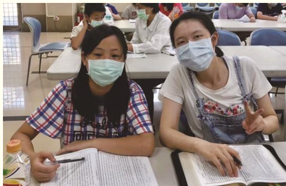
服事者陪青少年讀聖經

兄，這次也進步了，每天和服事者完成三十分鐘的讀經，在問答的過程中也都正確回答。有天睡過頭，仍然趕來參加了，感謝主！