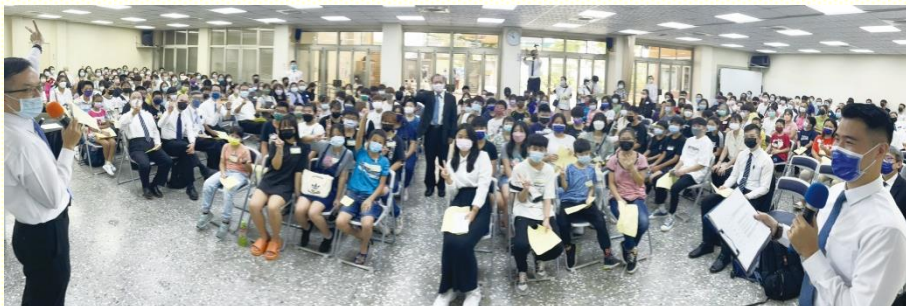
得榮少年獎助學金頒獎暨福音聚會