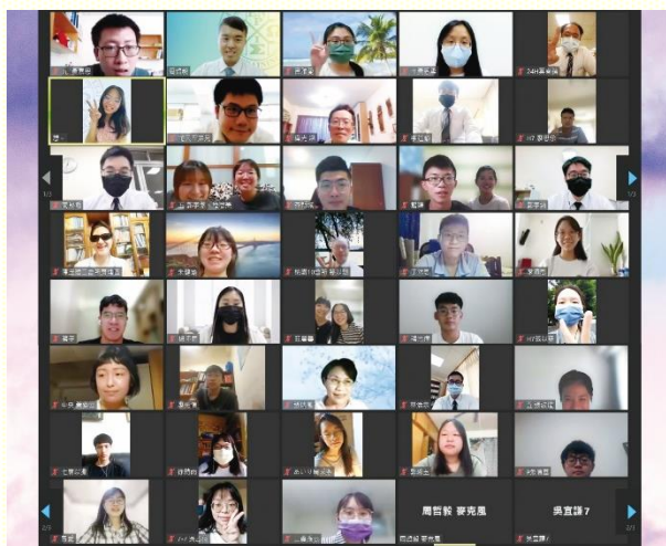
南區本地大專生團聚

南 區暑期本地大專生團聚於七月十六日舉行，然而因着疫情嚴峻，聚會無法像過去一樣實體進行。但感謝主，大專生們拿起負擔，主動尋求各樣的方式來突破疫情帶來的限制，因此外面的疫情雖然帶來聚會方式的改變，仍能藉着網路，與眾聖徒一同享受主！