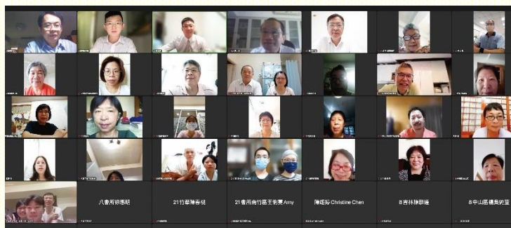
線上清晨禱研背講

還有一項特別蒙恩的點，在前半段弟兄們的禱研背講之後，我們安排青職弟兄有三到五分鐘簡短的信息鳥瞰，為弟兄姊妹們提綱挈領，復習整篇信息，幫助弟兄姊妹加強記憶，並且對整篇信息有綜觀全局的認識。同時這樣的實行也成全青職的弟兄們，在話語上服事聖徒，盡上他們的功用。