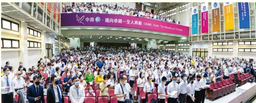
全召會集中擘餅暨相調聚會

為着賺錢、拼事業而活着，更不是過着宗教徒的生活，乃是過一個向主活的生活。所以需要規劃生活模式：要適合愛主，為主活着，