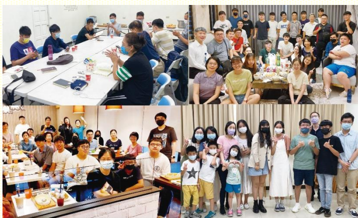
北區暑期本地大專生返鄉團聚

在蘆竹的大專生團聚中，透過詩歌相調，期勉大專生在學期間，蒙保守在主的 face 下。在龜山，服事者帶着大專生和區裏的聖徒一同愛筵相調，過程中關心彼此的召會生活、課業與實習生活；並在詩歌歡唱中，讓基督的愛將眾人聯結一起。在大園和龜山，除了愛筵，更帶着大專生和青少年，與區裏聖徒，一同走到戶外；在運動相調中，大專生學習服事更年幼的孩子們。而在桃園區的團聚中，藉由愛筵、芋圓 DIY，使大專生能在其中分享彼此