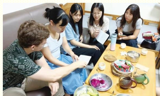
在家中牧養福音朋友

雖然已過兩年疫情影響，不適合羣聚用餐，但服事者與負責弟兄們在交通後，覺得仍然需要積極往前。與學生接觸和聚集的方式可能會受限制，但是對校園福音及牧養的負擔卻不該受限制。為着能在校園中得着百分之一的學生進到召會生活中，弟兄們不僅在主日聚集時將負擔傳輸給眾聖徒，也率先