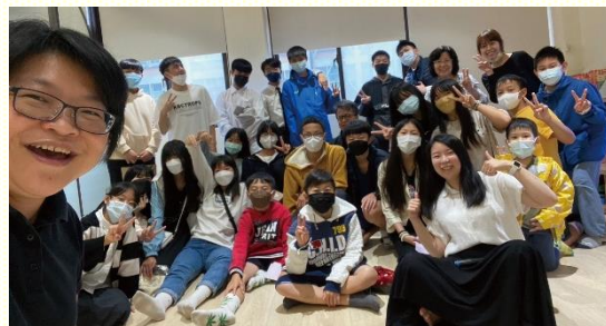
得榮少年與青少年一同相調