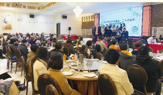
年終數算主恩聚會

本次年終感恩聚會特別邀請通霄鎮召會的弟兄姊妹前來，共享主恩。在擘餅聚會的唱詩讚美中，見證在主裏我們是一。藉着通霄鎮召會弟兄姊妹的介紹與見證分享，使我們對通霄當地的開展更有負擔。