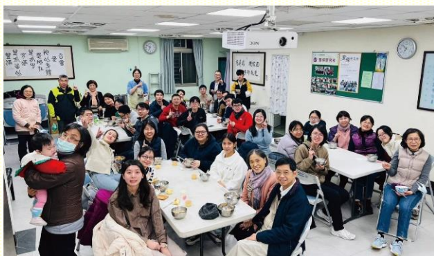
福音聚會用餐合影

在叩訪社區方面，雖然學員們缺少經驗，但主仍藉着職事的說話加強他們，使他們學習信心的功課。在第一週叩門時，就找着一位聖徒接觸過的福音朋友，並藉此恢復了對她的牧養。主藉着祂的話，一直不斷的將信心注入到這位朋友裏面。感謝主，在開展的最後一場福音聚會中，她喜樂的受浸得救了！何等喜樂能與學員們一同經歷，藉着堅