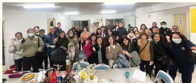
學員與配搭聖徒合影

傳福音不僅僅是傳講或教導，傳福音乃是爭戰。在過程中學員同聖徒不僅有個人與主私下屬靈的交通，更是藉着團體爭戰的禱告，經歷主的靈七倍加強每一位，捆綁那壯者，洗劫他的家具，將人擄來歸祂。操練只憑信心，不憑眼見，有主作活的信。藉着與聖徒緊密的配搭，一同為人爭戰禱告，叩門探望人，享受人受浸得救的喜悅，一同家