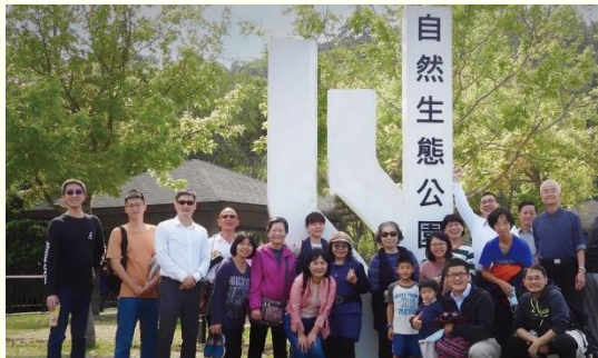
三坑自然生態公園合影

大家裏外都得飽足。因着主使我們聯調為一，彼此的距離間隔都除去了，並充滿了主的甜美與喜樂。除了很珍惜實體的接觸與互動外，弟兄姊妹也藉着主的話向邀約來的福音朋友傳福音。藉着喜樂的相調，願弟兄姊妹能脫離疫情所帶來的影響，盡快恢復正常的召會生活，並恢復參加實體聚會而得着主更多的傳輸與供應。