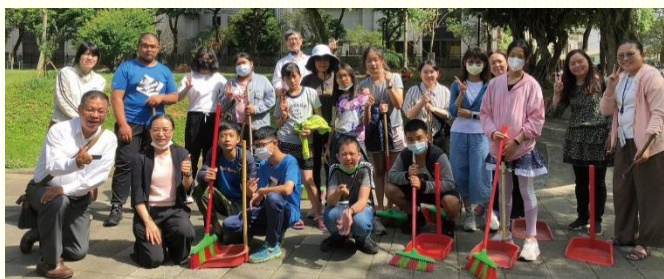
成功公園公共服務

第二堂課是人生奧秘中的四把鑰匙，由四位青少年向得少們介紹神的經綸。四位青少年都很