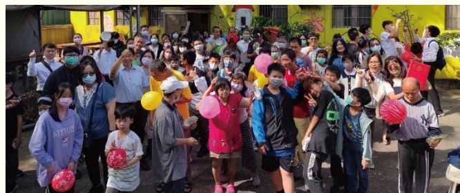
嘉惠啟智教養院服務

下午的時間，除了完成學習單，也到嘉惠啟智教養院服務院生們。一開始大家一同歡唱詩歌，在一片歡樂的氣氛中，一邊唱一邊作動作。因着人數眾多，唱完詩歌，不僅將院生分為兩組，青少年和服事者也分為兩組，接續進行說故事和手作紙盤小花的課程。在過程之中，不論是得榮少年或青少年，大家都很用心的參與其中，成為院生的幫助者。我們所服務的院生，外表是年長的年紀，但是心智卻只有幼稚園的年齡。陪伴他們的過程中，藉着青少年們的付出與幫助，看到院生們有着開心而純真的笑容。雖然志工服務的時間比較短暫，卻是很有意義，院方也非常歡迎我們下次繼續來訪。