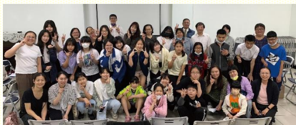
中照顧區生命成長園

第一堂課是『得榮小劇場』。男生一組，女生三組，共分成四組。各組派代表抽一個表演題，準備十分鐘，上臺表演三至五分鐘，題目只有簡單的