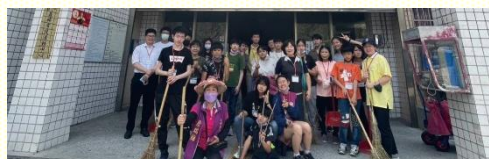
義興公園公共服務

會與得榮少年和其他青少年們有更深入的交流，使每一位裏外都得着飽足。用餐結束後，我們