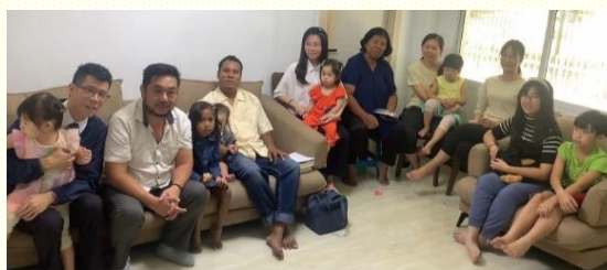
聖徒家中主日聚會