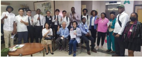
桃園赴會外語生合影

此外在銘傳大學及元智大學的外語生，更是藉着會所聖徒們殷勤竭力的服事，讓他們都能順利的在特會中享受一個身體的交通。大會服事也