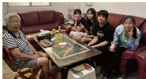
青少年學習看望年長聖徒

家中該注意的事項，包括打招呼、如何送出手中的禮物。這樣的過程使青少年們不只是玩樂，也有生活的學習。