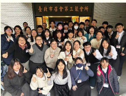
大專現場訓練合影

特別享受第二篇信息的供應，說到我們可以與內裏運行之三一神這生命的律合作，『打開』這律的『開關』。打開這開關的路，乃是藉着向那靈敞開，一早就花時間來觀看主，沐浴在祂面光中，被祂榮美浸透。並思念那靈的事，就是將心思置於靈，如羅馬書八章六節說，『因為心思置於肉體，就是死；心思置於靈，乃是生命平安。』藉着操練