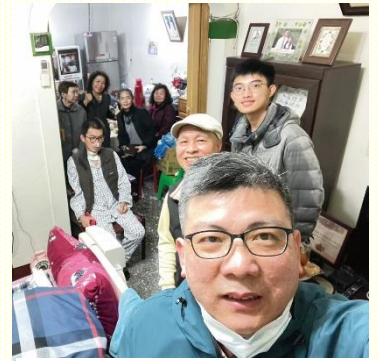
家中夜間擘餅聚會

有另外一個家為了照顧在家醫護的兒子，夫妻二人只能輪流外出參加主日聚會，留下一位在家照顧。經過交通，今年初，在這個家設立主日夜間擘餅，由各區弟兄輪流前去服事。這對夫婦也是愛主，渴慕主日聚會，所以在與他們交通時，他們很快的就答應了。感謝主，這一切都是主作的，直到如今，在這個家週週有主日夜間擘餅。就像希伯來書十章二十四至二十五節：『且當彼此相顧…不可放棄我們自己的聚集。』不要放棄我們的聚集，藉着弟兄姊妹彼此相顧，每位聖徒都能有分聚會，享受到聚會的豐富。