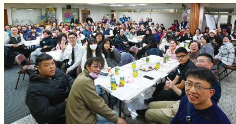
得榮少年證書頒發暨福音聚會

愛和光中行事為人。有愛，就是神內在的本質，並有光，就是作神外顯的元素。在這次的聚集裏，滿了愛和光，每一位與會者皆洋溢着喜樂的面容。願主得着我們，更多與祂調和成為愛、成為光，也得着每一個得榮少年的家，都成為滿了愛與光的家，也將愛與光傳播出去。