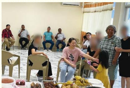
數算主恩聚會後合影

已過的一月一日，在帝利會所有『數算主恩暨展望』的聚會。藉着服事者製作的投影片，聖徒們回顧去年所蒙的恩典。從去年開始，新會所的啓用幫助不同語言的聖徒相調在一起；臺灣的弟兄們來看望，加強眾人福音的靈及負擔，陸續有新人受浸得救，受浸人數剛好達到去年的目標；每月第一個主日晚上的福音愛筵，讓聖徒們在福音上學習盡功用，也讓一些福音朋友成為我們固定邀約的對象；有兩位從利達薩市來訪的聖徒，讓我們知道在帝利市之外也有聖徒，使開展有新的方向。這些蒙恩加強了帝利召會的聖徒們，新的一年更新奉獻自己，在福音、牧養及真理追求上往前。