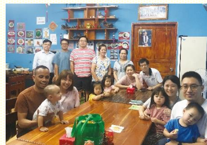
與福音朋友用餐相調

我們初來到東帝汶時，只有德頓語版本的『人生的奧秘』小冊子，給聖徒傳福音使用。於是服事者們先與『雷瑪文字推廣』有交通，索取總共一百二十本英文版的『基督徒生活的基本要素』第一、二冊及『包羅萬有的基督』。在路上接觸懂得英語、知識水平較高的人，有大學生、上班族、餐廳服務生等。其中有人拿了一本，之後在路上遇到我們，主動再索取了一本；也有人拿到了，直接就坐在路邊開始讀了起來。