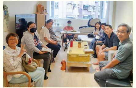
實體小排聚會合影

意在線上聚集的情形，向主禱告能恢復實體聚集。自三月開始，從原先二、三位聖徒實體聚集，聖徒們陸續都受到吸引，目前有十多位聖徒回到實體聚會。實體聚會最大的好處就是能真正關心到彼此的需要，藉着這樣的關心，聖徒們每週輪流到不同的家裏聚會，一段時間外出相調，主就把人數加給我們。一些原先在線上排聚集的聖徒，也因此恢復了實體聚會，開始盡功用。