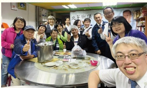
壯年班學員與當地聖徒合影