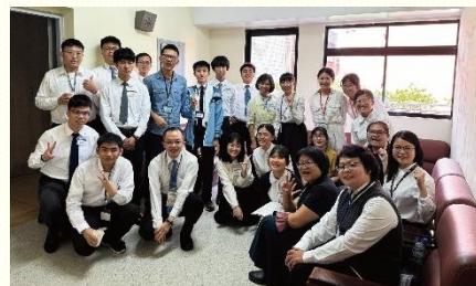
現場訓練桃園大專合影

信息也交通到，發芽的杖表徵基督是復活者，在民數記十六章五節上，『我揀選的那人，他的杖必發芽…。』說出復活乃是事奉神永遠的原則。復活就是一切都是出於神，不是出於我們，只有神能，我們不能。學生見證，他們越依靠天然的力量服事，就越無法作得好，惟有依靠那作為包羅萬有之靈的三一神，纔能應付一切的需要。