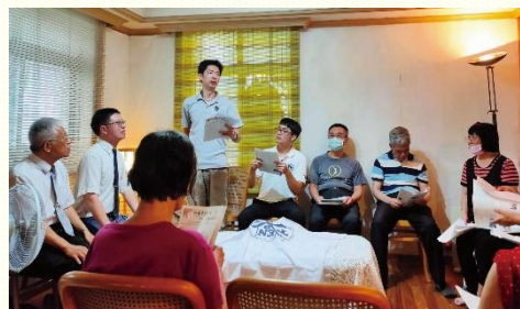
增區後首次擘餅聚會

八月十一日，開始第一次的主日聚會，感謝主，共來了二十五位聖徒。擘餅聚會中，眾人唱詩，靈裏喜樂高昂，申言聚會中彼此先有進一步的認識並有當週信息申言。因得着供應，眾人靈裏都喜樂滿懷。感謝主，增區後，每個人都能盡功用，擺上自己的那一分，一同配搭服事。