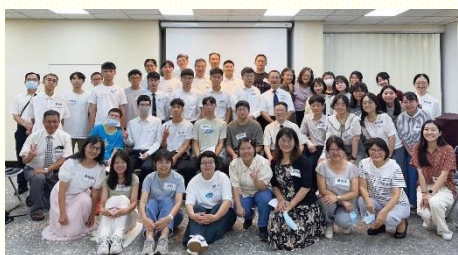
南區本地大專團聚合影

此次聚集除了讓大專生彼此認識，亦盼望傳輸關於聚會的重要性與負擔。李弟兄在初信造就第十二篇關於聚會的信息中題到，聖經教導人『不可停止聚會』，因為聚會是領受團體恩典的途徑。神的恩典分為個人恩典和團體恩典，個人禱告神會聽，然而許多重要的禱告和聖經啓示需要在聚會中纔能得到。