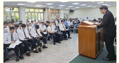
南區弟兄相調特會

面的生活，而是照着裏面奇妙的生命而過的生活。要把人帶進這國度實際裏，自己要率先進到這實際裏，在職場、家庭中照着神聖的生命而生活。』無論我們在那裏，都需要活在神聖生命的範圍裏。