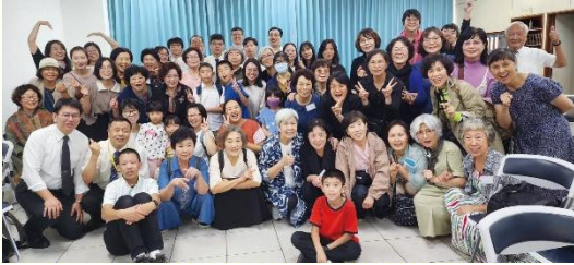
與韓國聖徒相調合影

十月十九至二十日，五及二十二會所迎來一次難得的國際相調機會。來自韓國京畿道眾召會的二十九位姊妹和一位弟兄，為參加全臺姊妹事奉相調特會而至臺灣訪問，與本地聖徒有兩天一夜的相調機會。這次接待雖然很臨時，但在主的帶領下，顯出了神家中的愛與合一。