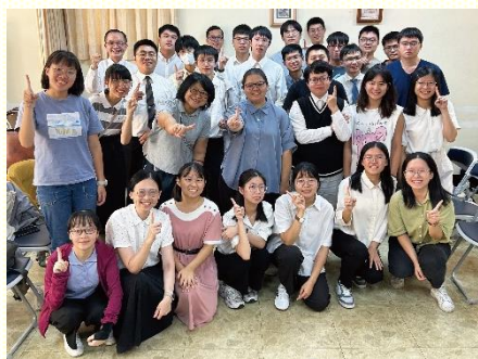
大專生畢業座談合影

大專畢業生座談於十月十九日在二會所舉行，與會人數共四十九位，其中有二十四位學生，本次座談的內容有四個專題，分別是升學、婚姻、就業及訓練，藉由職事信息和見證的方式向學生傳輸。