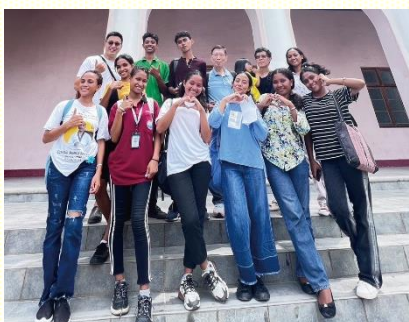
在校園附近接觸大學生

此外，為了促進不同語言聖徒間的相調，建造在一起，我們也鼓勵華語聖徒學習印尼語。服事者們每天製作屬靈材料，供華語聖徒學習，幫助他們使用印尼語分享。願主得着帝力召會，使語言不再成為聖徒間相調的攔阻，並使聖徒們更深的進入真理，享受基督豐富的供應。 (趙俊倫)